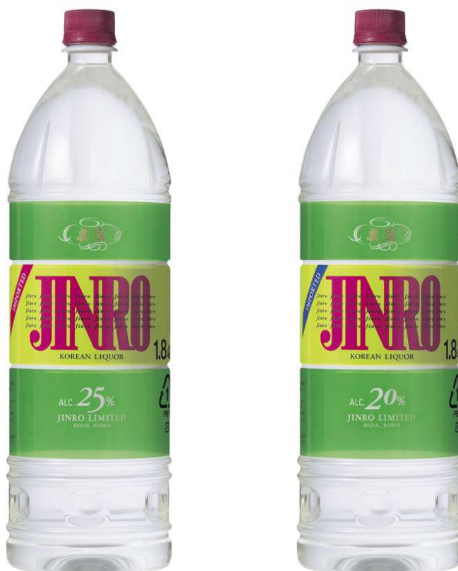
左「JINRO 1.8L 25度」、右「JINRO 1.8L 20度」

眞露ジャパン株式会社（代表取締役：韓徳昊 ヘンドクホ 、本社：東京都港区）は、焼酎「JINRO」の大容量ペットボトル「JINRO 1.8L」（25度・20度）のパッケージ・デザインをリニューアルし、2006年1月上旬より全国に順次出荷いたします。今回のパッケージ・デザインリニューアルは、「JINRO 2.7L」「JINRO 4L」とデザインの統一性を図り、大容量ペットボトルのラインナップ全体で一元的な販売活動を目指し行うものです。新パッケージは、スッキリとしたピュアな味わいを表現するために透明感を重視し、より「JINRO」らしく高級感あるデザインに仕上げました。