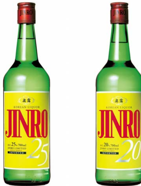
左: JINRO 700ml 25度 右: JINRO 700ml 20度